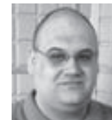
Др Јован Чавошки Институт за новију историју Србије