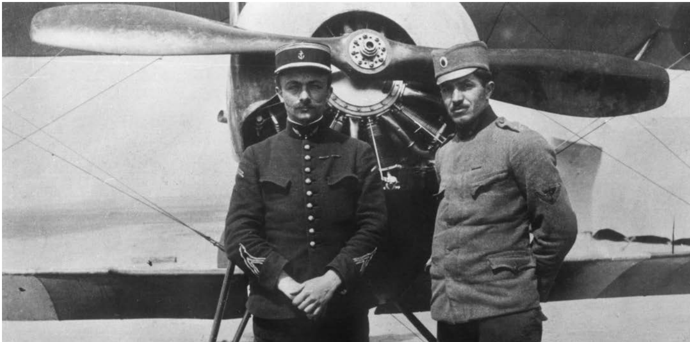
Француски и српски официри испред авиона „Њепор“, село Вербени, Солунски фронт, 1917.

пломатским односима, посебно у сложеном односу који је проистакао из постојања четничког покрета Драже Михаиловића и учешћа Југословена у француском покрету отпора, као и промени система 1945. године.