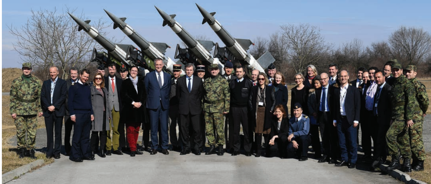
Представници Института за високе студије НО Републике Француске у касарни „Јаково“

ипак настављене набавке у СССР-у и државама источног лагера, мада су се разматрале и перспективе преоружања и понуде са Запада. Управа оклопних јединица добила је тада понуду за куповину оклопних транспортера фирме „Хочкис“ из Француске, која међутим није ни разматрана јер је закључено да је достављена без детаљних података. Простор за наставак француско-југословенске сарадње створио се 1. октобра 1971. године. Тада је СФРЈ купила лиценцу модерног лаког хеликоптера SA-341 „газела“ од француске фирме „Aerospacial“. Реч је о делимичној лиценци са кооперацијом с циљем избегавања кашњења, а по договору предузеће „Соко“ требало је да производи поједине делове за поменути француску фирму. Све до 1979. године, када су се појавиле прве „газеле“ лицендне производње, користили су се само они француске производње. У периоду од 1975. до 1979. године набављене су брзе филмске камере (испитно-мерна опрема) француског произвођача „AIR OCEANIA“, док је „SIDETEL“ извршио модернизацију предратних немачких кинотеодолита уградњом филмских камера на три мерне станице. Потом је