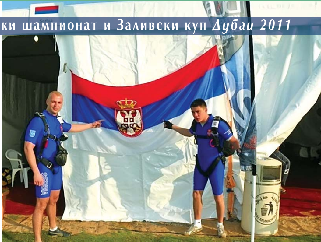
Српски падобранци на такмичењу

Падобранци и из земаља Персијског залива и из целог света такмичили