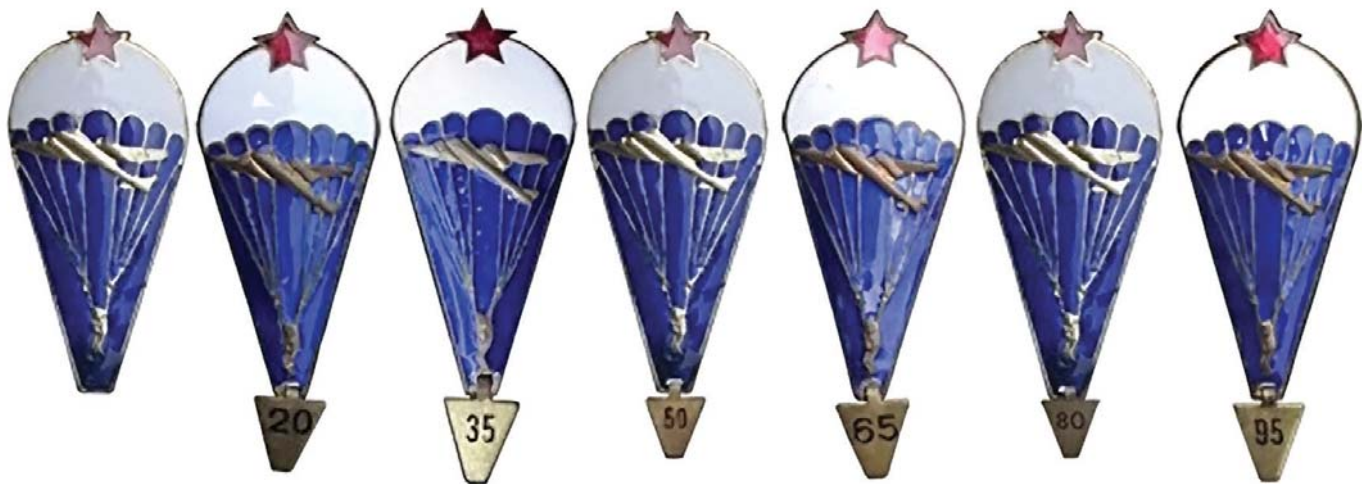
Варијанте знака „падобранац“ с различитим бројем скокова

а да се од ње и трију армијских падобранско-извиђачких чета образују три самостална падобранска батаљона, који ће припадати ваздухопловним командама, односно командама 1, 3. и 5. армије.