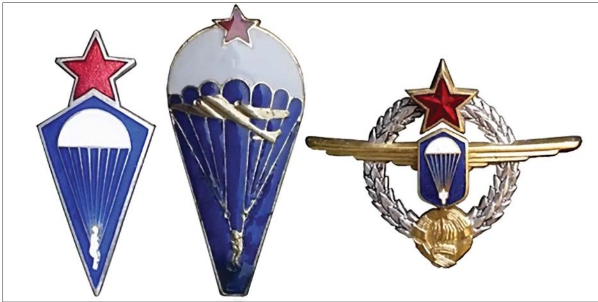
Падобранска звања из 1957. године – „ученик-падобранац“, „падобранац“ и „инструктор падобранства“