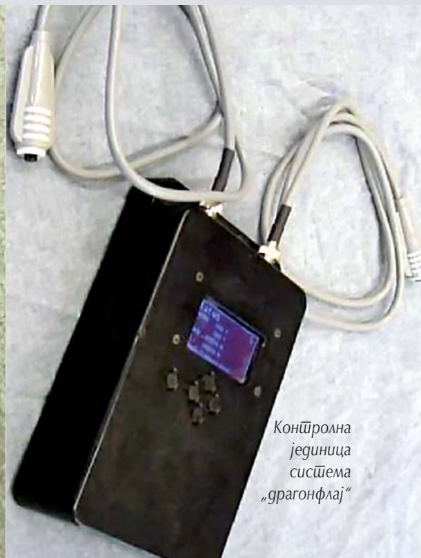
Контролна јединица система „драгонфлај“

Систем је компатибилан с GPADS планером акција и усклађен је са свим издањима софтвера за тај планер. Такође је подешен за 802.11 бежични интерфејс, који омогућава кориснику да програмира систем помоћу GPADS MP планера акција или коришћењем јединице даљинске контроле, те омогућава даљинско праћење стања система. Поменуто обезбеђује максималну техничку подршку јединицама распоређеним на изолованим оперативним зонама.