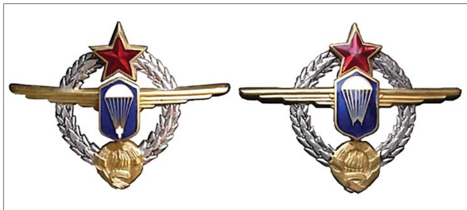
Знакови инструктора падобранства 1. и 2. класе

Осам година касније, 5. децембра 1967, на нишком аеодрому поново се окупила 63. падобранска бригада, у чији су састав ушли Падобрански наставни