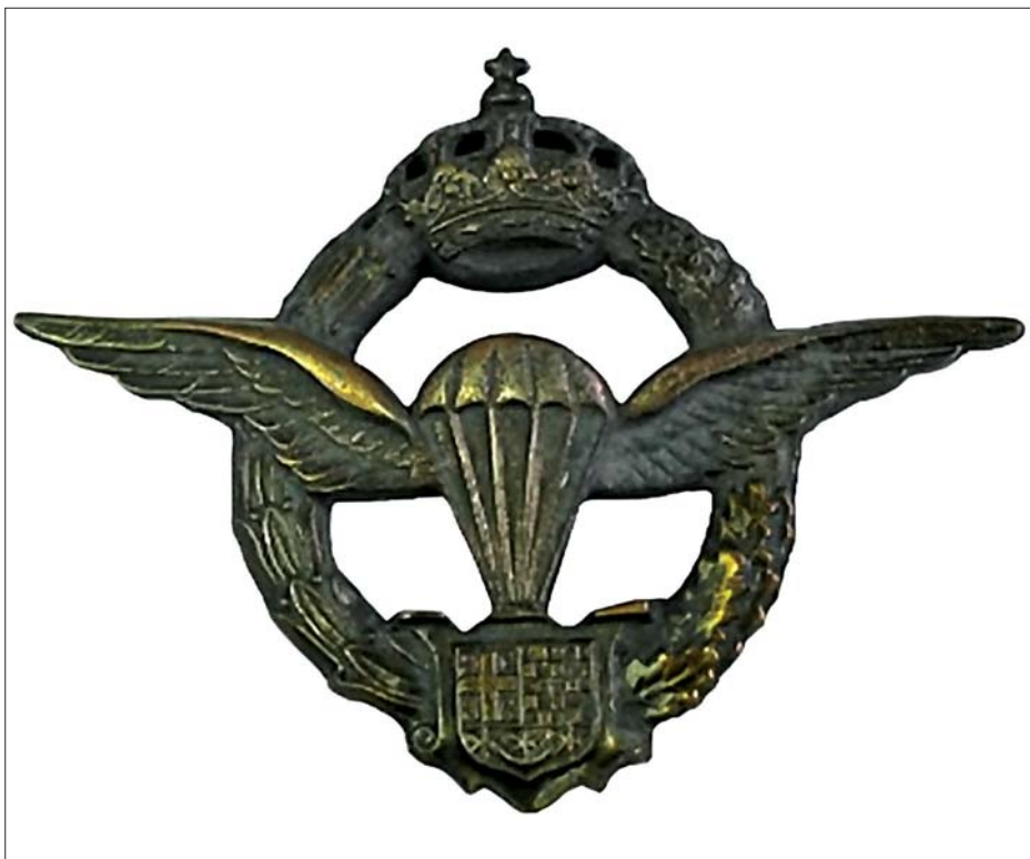
Знак падобранаца Југословенске војске у оштакбини

Падобранци 63. падобранске бригаде су према војним прописима из 1957. године, у зависности од степена обучености, добијали падобранска звања: уче-