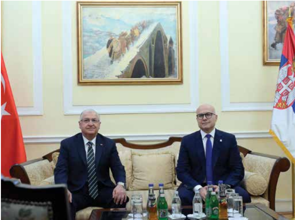
Сусрет министра Вучевића са турским колегом Јашаром Гулером

Косову и Метохији. Изнео је очекивање да ће мисија непристрасно, и у складу с додељеним мандатом, утицати на спречавање будућих једностраних акција, које доводе до деградације безбедносно осетљиве ситуације. С тим у вези, он је изразио уверење да ће Команда здружених снага НАТО-а у Напуљу предузети мере из своје надлежности, како би спречили будуће једностране акције Приштине и погоршање безбедносне ситуације у јужној српској покрајини.