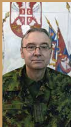
Пуковник Лазар Остојић