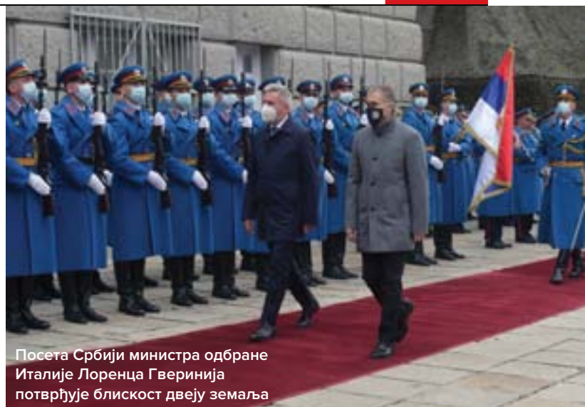
Посета Србији министра одбране Италије Лоренца Гверинија потврђује блискост двеју земаља

– Наше стратешко партнерство врло јасно осликава и снажна економска сарадња, јер је Италија један од водећих инвеститора у нашој земљи, али и чињеница да Италија снажно подржава евроинтеграције Србије. Сарадња у области одбране је на изузетно високом нивоу, а данас смо разговарали и о могућностима њеног даљег унапређења – рекао је након састанка министар Стефановић, који је потврдио да је међу темама било и заједничко учешће наших оружаних снага у мултинационалним операција-