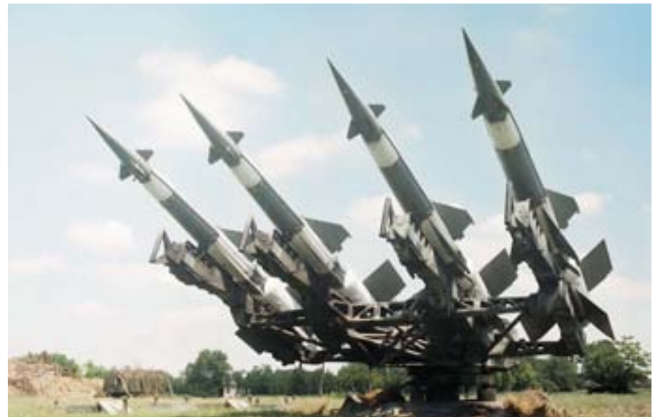
Ракете 5В27Д у режиму „припрема 1”