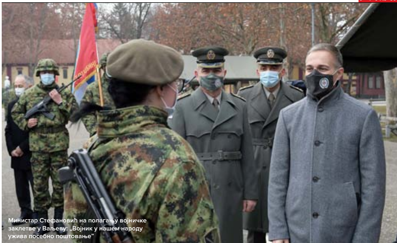
Министар Стефановић на полагању војничке заклетве у Ваљево: „Војник у нашем народу ужива посебно поштовање”

њу и она ће захваљујући домаћим институтима и домаћем знању бити модернизована и коришћена за опремање наше војске – изјавио је министар одбране.