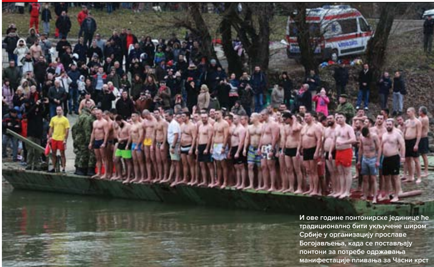
И ове године понтоњирске јединице ће традиционално бити укључене широм Србије у организацију прославе Богојављења, када се постављају понтони за потребе одржавања манифестације пливања за Часни крст