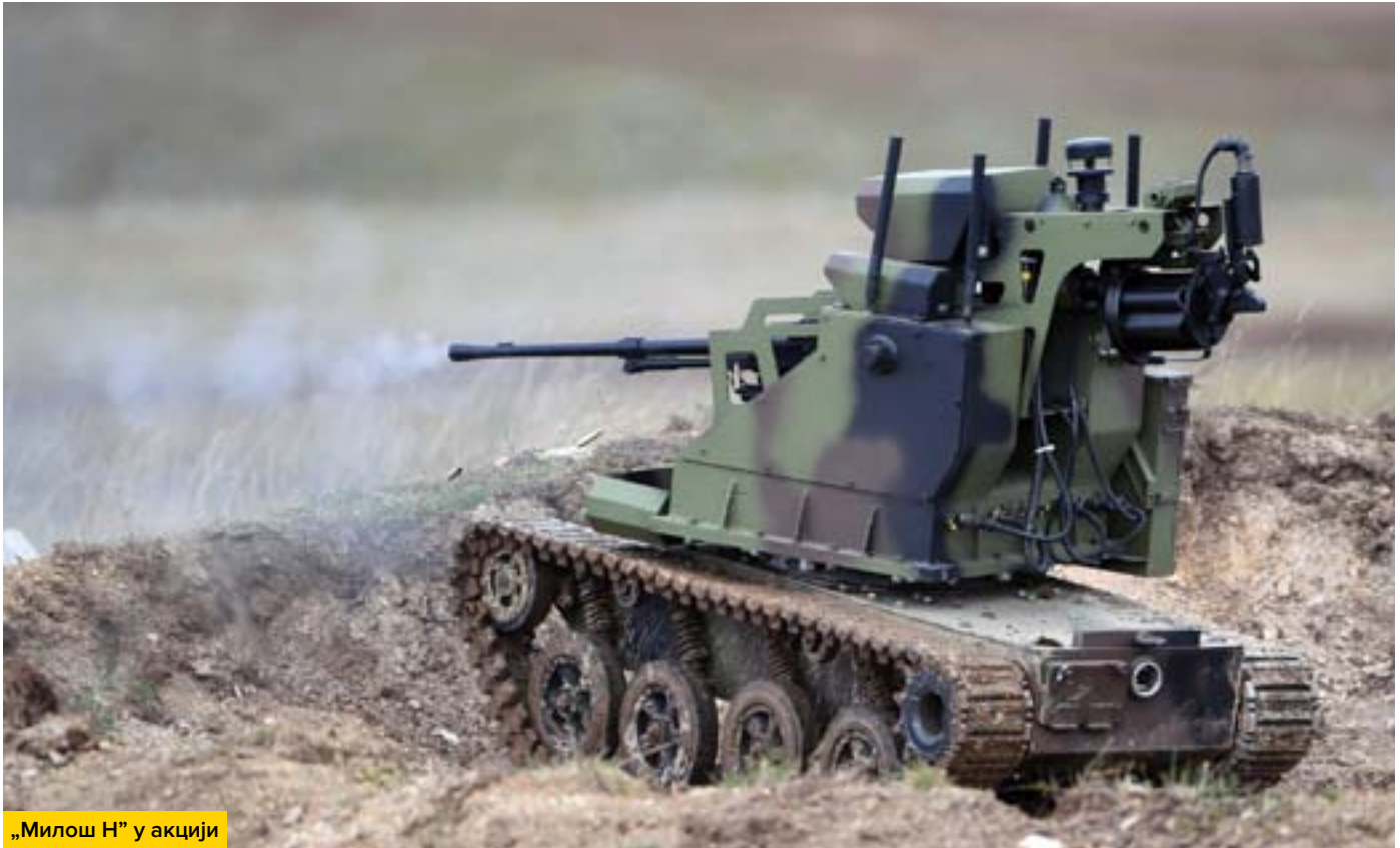
„Милош Н” у акцији

од командног возила или преносног командног рачунара, око два километра, и да поседује митраљез који може успешно дејствовати по циљу на даљинама до 800 m, то значи да се непосредни руковалац платформе налази на удаљености од око 2,8 km од линије ватре и дејства овог система.