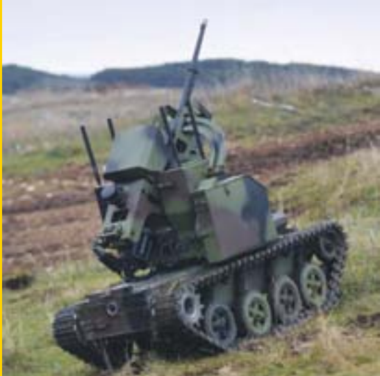
Пише Владе РАДУЛОВИЋ