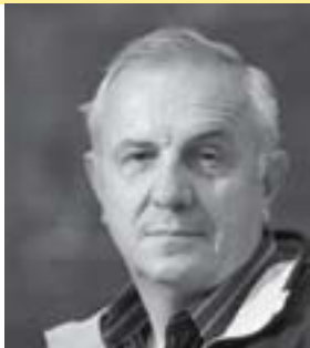
Пише Слободан РЕЉИЋ