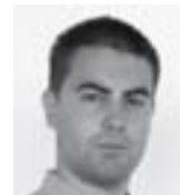
Владе Радловић војно-политички аналитичар