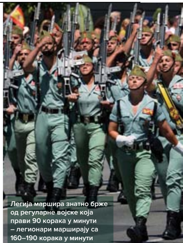
Легија маршира знатно брже од регуларне војске која прави 90 корака у минути – легионари марширају са 160–190 корака у минути

Савремену Шпанску легију чини око 5.000 легионара сврстаних у једну бригаду и два самостална пука. Бригада је са два своја пука стационирана на шпанском тлу, док се самостални пукови налазе у шпанским афричким енклавама Сеути и Малиљи. Легија је директно потчињена шпанском генералштабу и чини ударну песницу шпанских војних снага намењених за брзо реаговање. Бригада легије настала је 1996. прерастањем дотадашње 23. моторизоване бригаде у 2. бригаду легије. Као таква, одмах је постала саставни део шпанских снага за брзо реаговање. Њена команда данас се налази у Виатору и потчињени су јој командни батаљон, лаки оклопни батаљон опремљен оклопним возилима италијанског порекла типа „Бентауро” и извиђачким оклопним возилима шпанске производње типа VEC M-1, 3. пук легионара који чине два пешадијска батаљона на оклопним возилима шпанске производње типа BMR M-1, 4. пук легионара с два батаљона моторизоване пешадије, дивизион полске артиљерије опремљен хаубицама типа L-118A1 калибра 105 милиметара, инжињеријски батаљон, као и јединице намењене за логистичку подршку. Ван састава бригаде налазе се још два пука легионара који су стационирани на северу Африке – 1. пук у Малиљи, док је 2. пук стациониран у Сеути. У оквиру легије налази се и батаљон намењен за специјал-