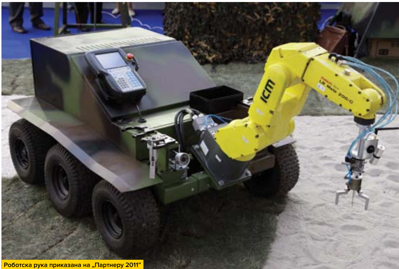
Роботска рука приказана на „Партнеру 2011”

Након успешно завршених тестова са системом „милица” инжењери Војнотехничког института одлучили су да наставе са даљим развојем борбених беспосадних роботизованих земаљских платформи. Добра полазна основа „милице” била је идеална за напреднију верзију сличних габарита и намена. Тако су пратећи светске трендове стручњаци ВТИ и „Прве петолетке – Наменска” из Трстеника развили даљински контролисану борбену беспосадну земаљску платформу средње величине „милош Н” (наоружани), познатију као „мали милош”.