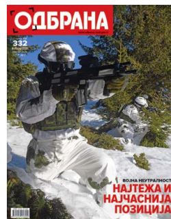
Насловна страна Обука специјалаца на Копаонику

Припадамо српском роду и ту смо да бисмо помагали једни друге и увек ћемо то чинити – рекао је председник Републике Србије приликом свечаног отварања погона фабрике „Јумко“ у Дрвару.