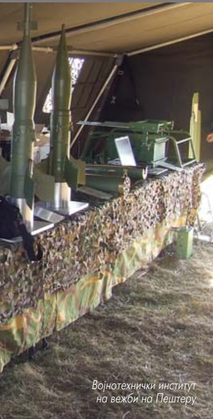
Војнотехнички институт на вежби на Пештеру

додатне приходе, које користи за даља улагања у истраживачке и развојне пројекте. Хтео бих, такође, да истакнем и чињеницу да нас посећује велики број страних делегација са циљем сагледавања могућности заједничке сарадње.